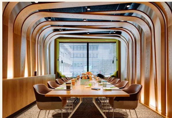
↑ Tagungsraum Ideenlaube im Lindner Hotel Düsseldorf Seestern