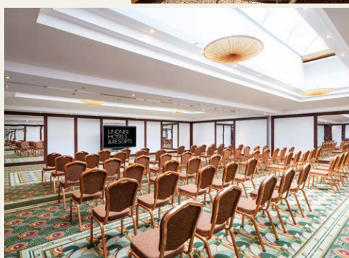
← Tagungsraum im Lindner Hotel Prague Castle