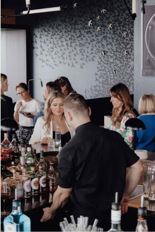
BU: Ein Nachmittag zum Entspannen und Netzwerken