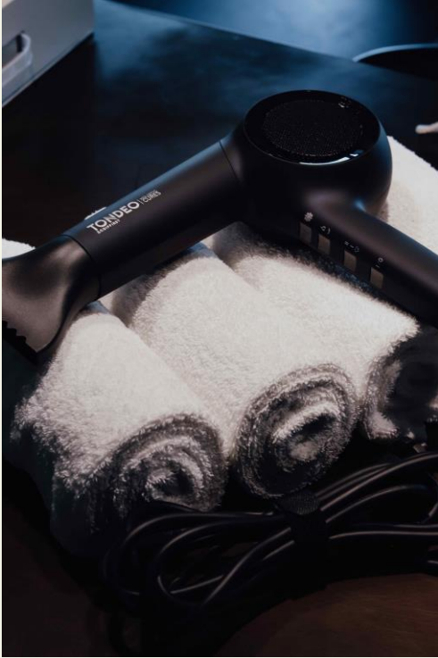
BU: TONDEO Holistic Cures