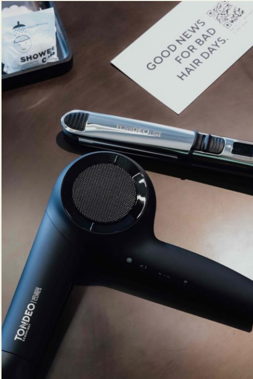
BU: Good news for bad hair days