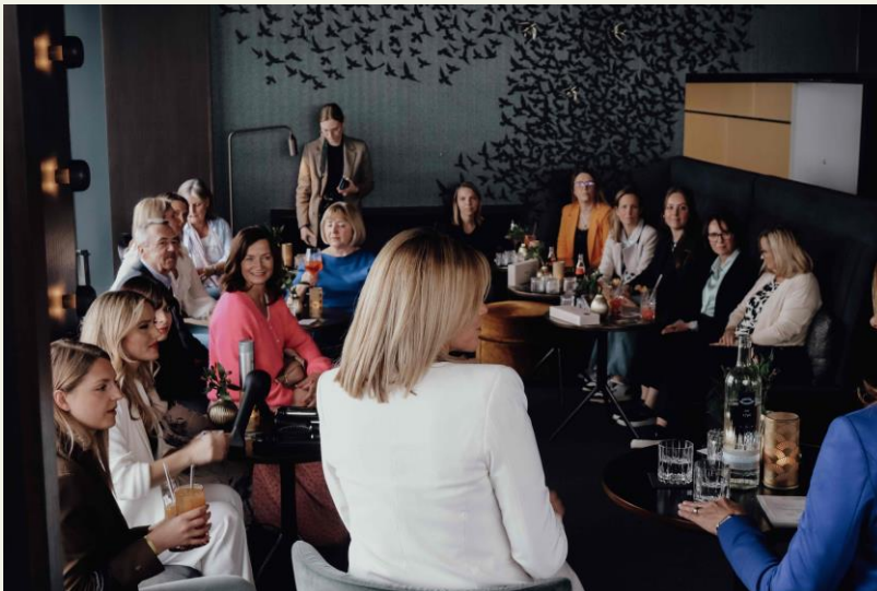
BU: Ladies (fast) unter sich