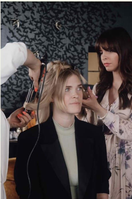
BU: Sanfte Wellen zaubern mit dem TONDEO CERION 2IN1